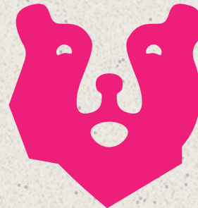
X Farbe darf nicht verändert werden