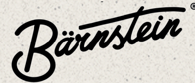
X Größenverhältnis zwischen Wort- und Bildmarke ändern